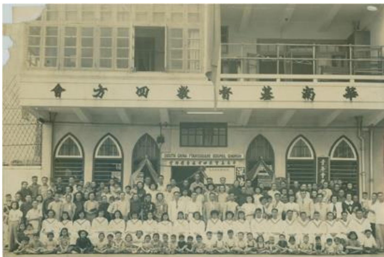
一九四九年週年紀念合照（西洋菜街堂門外）。

立的第一間教會。艱苦工作了數年，可惜在一九四二年日軍侵佔香港，大部分會友離港，事工因而被迫停頓。和平後於一九四六年在花園街租地方重整工作，事工重新開始。當時亦曾差派同工到廣州的一德路開拓福音工作，可惜只有一段短時期便停頓了。華南區只有香港仍維持福音工作，直至一九四九年購入西洋菜街 215-217 號地段，教會才有屬於自己的地方發展事工，同時亦開辦了深培學校，事工亦進入了一個新的階段。